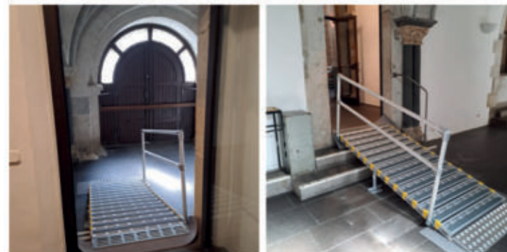
Mobile Rampe in der Vorhalle von St. Andreas, Köln

Liebe Gemeindemitglieder und Gäste in St. Andreas!