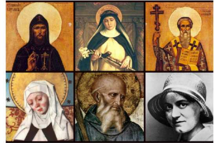
Europe Patron Saints Mosaic