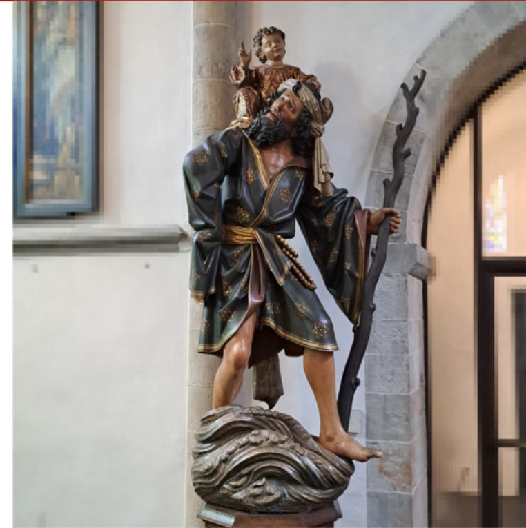
Hl. Christophorus | Werkstatt des Meisters Tilman, Holz, Köln um 1500 | St. Andreas, Köln | Foto: Daniel Stadtherr